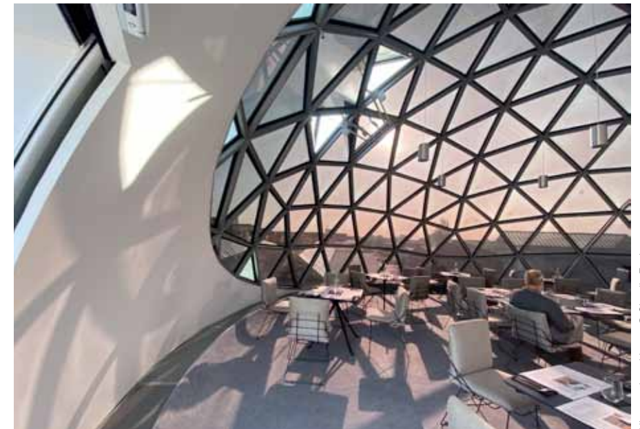
Niemeyerkugel innen

Flüge ab/bis Wunschflughafen, Shuttle Airport-Hotel-Airport, Verlängerung des Aufenthalts