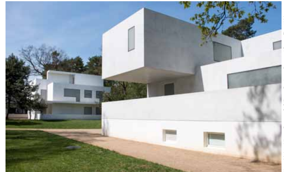
Neue Meisterhäuser Dessau